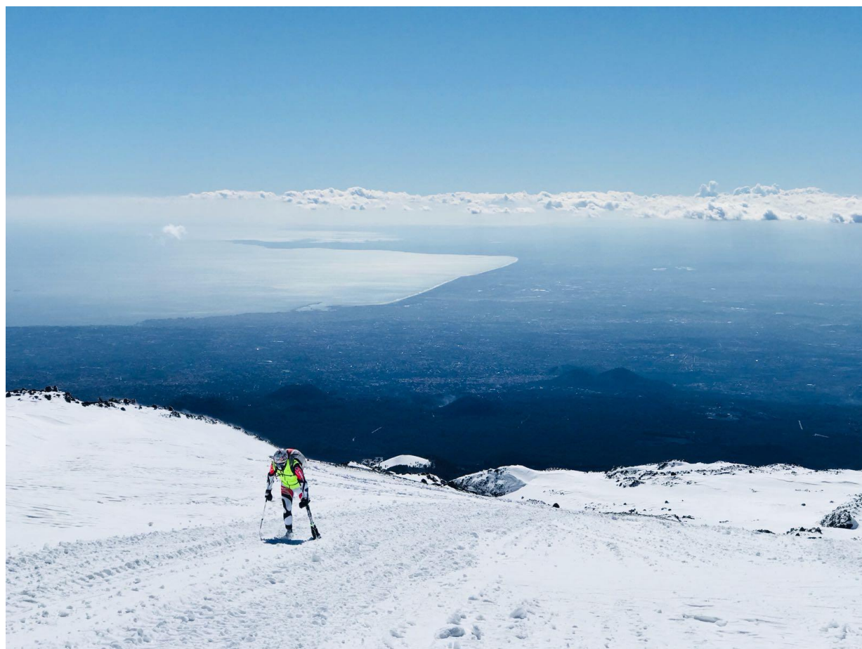
2017: Team 3 gambe