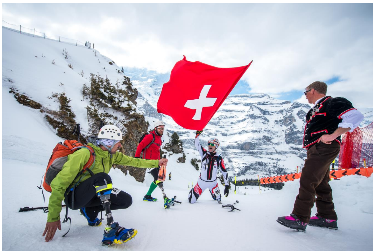
2019: Punta Penia