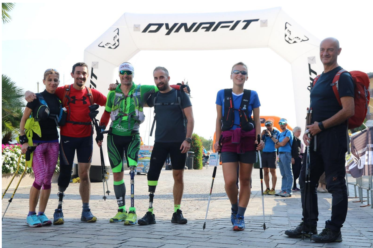
2018: Team 3 gambe